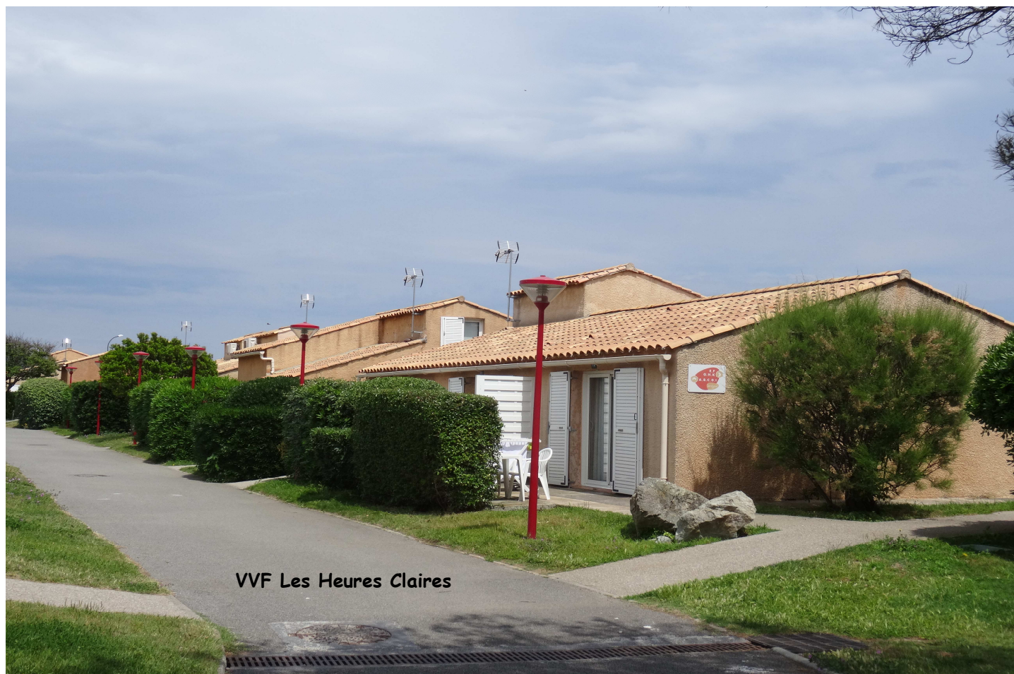
VVF Les Heures Claires