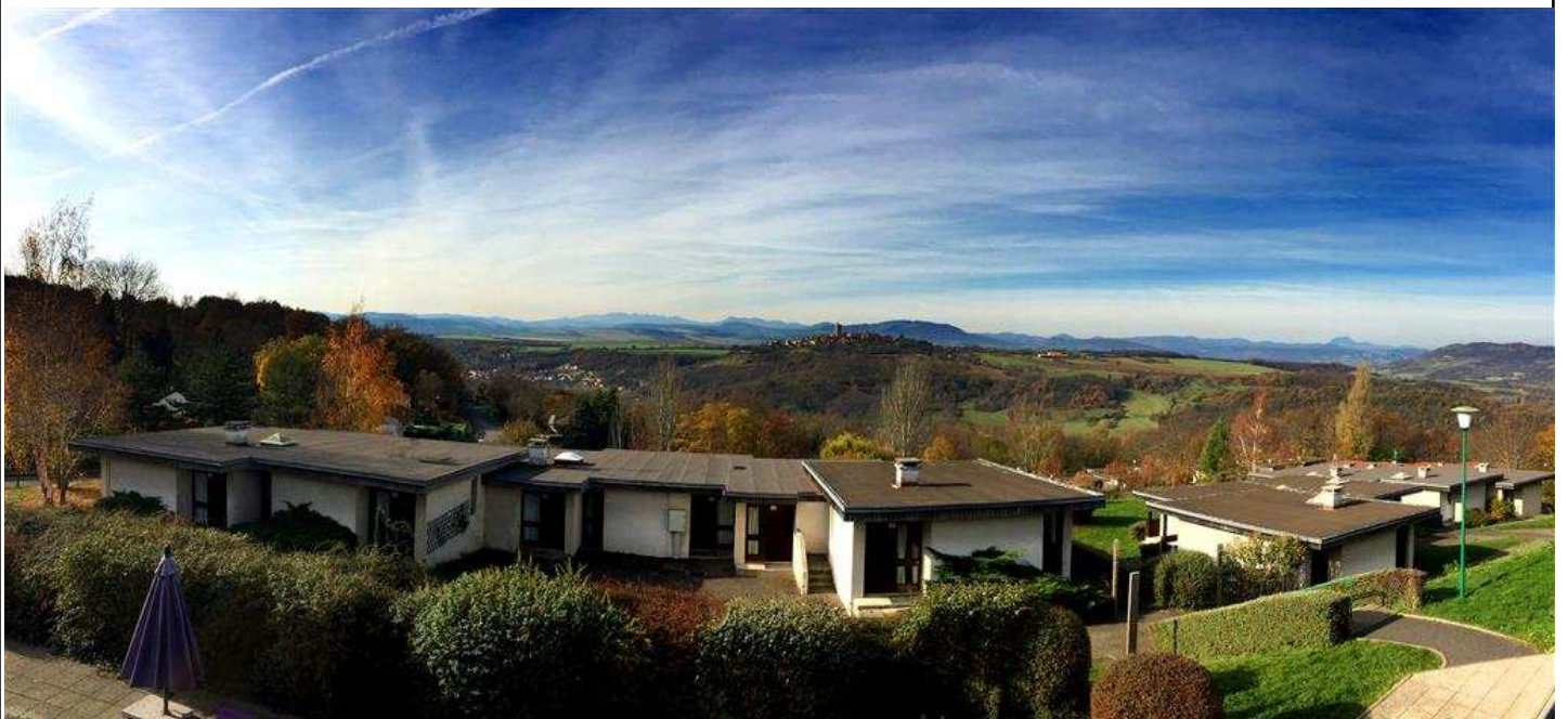
VUE PANORAMIQUE DU VILLAGE